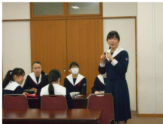
新生徒会長から「先輩から引き継いだものを形にしたい」とのお話がありました。