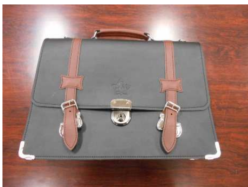
制カバンに反射材を付けたい！