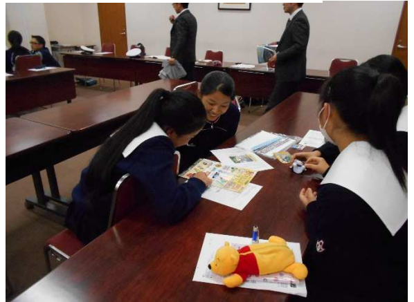
実際の反射材を確認しました。