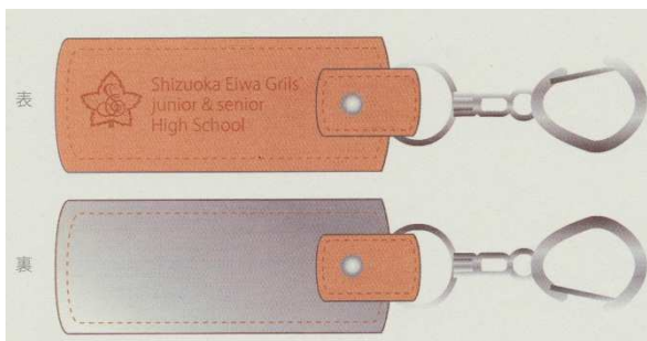
反射材普及協会から「こんなキーホルダー型反射材はどうか」と提案がありました。 校章と学校名が型押しされています。