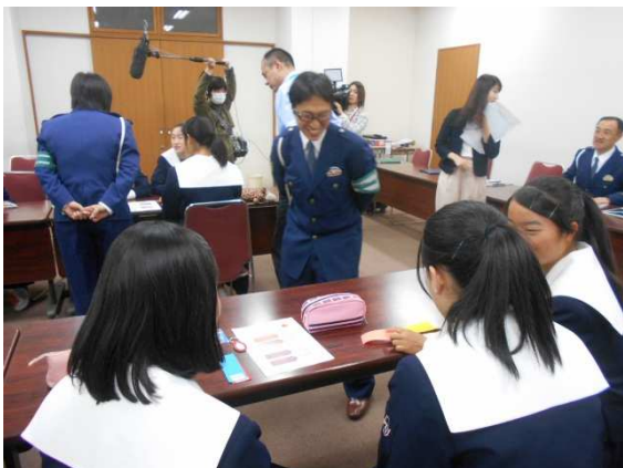
警察官を交えて意見交換をしました。