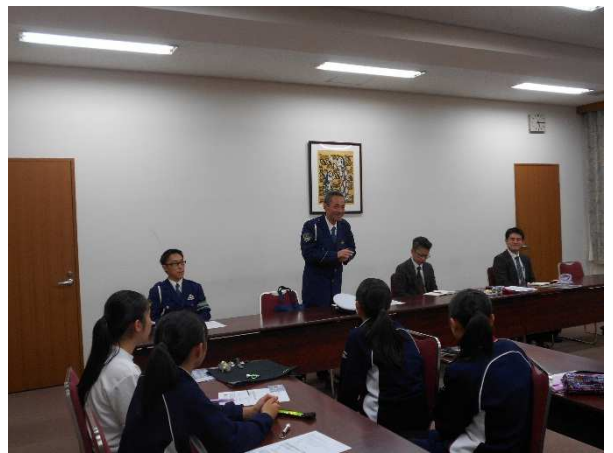
静岡中央警察署交通第一課長から挨拶がありました。