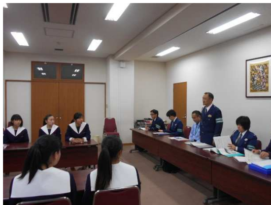
静岡中央警察署交通官から挨拶がありました。