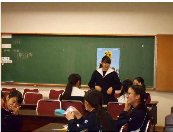
グループに別れ、意見発表しました。