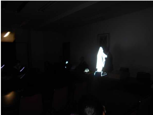
生徒会が新体制になったので、もう一度反射材の効果を勉強しました。