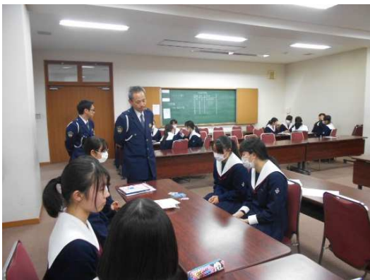
生徒で意見交換をしました。