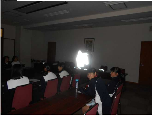
まず、反射材の効果を勉強しました。