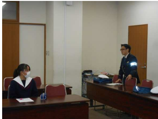
警察官からこれまでの流れを説明しました。